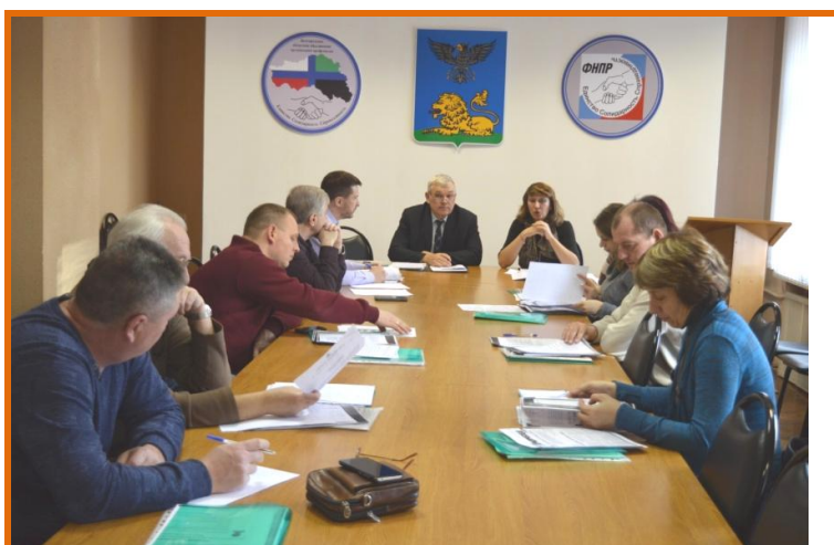
Обучение профсоюзного актива на тему «Новое в трудовом законодательстве РФ».